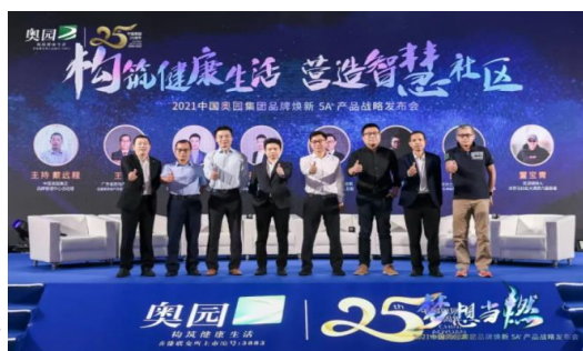
「構築健康生活·營造智慧社區」主題沙龍

有別於傳統產品，奧園5A+產品力體系通過軟硬結合解決客戶從體驗到服務的全過程，基於「居住家、鄰里家、城市家、匠心家和服務家」五大板塊下的22個模塊及近百餘項的價值細節，致力為客戶打造「有情感的健康」和「有溫度的智慧」。